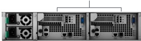
Модули с двумя контроллерами