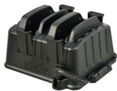
Зарядное устройство на 2 батареи