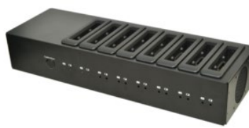
Зарядное устройство на 8 батарей