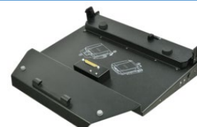
Док-станция для офиса