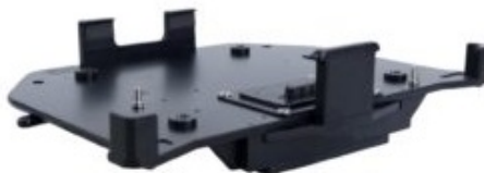
Док-станция для транспорта, RF Pass-Thr