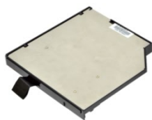
Быстросъёмный накопитель в слот Media-Bay