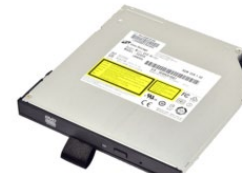
Съёмный DVD Super Multi