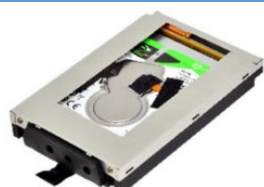
Быстросъёмная корзина с накопителем